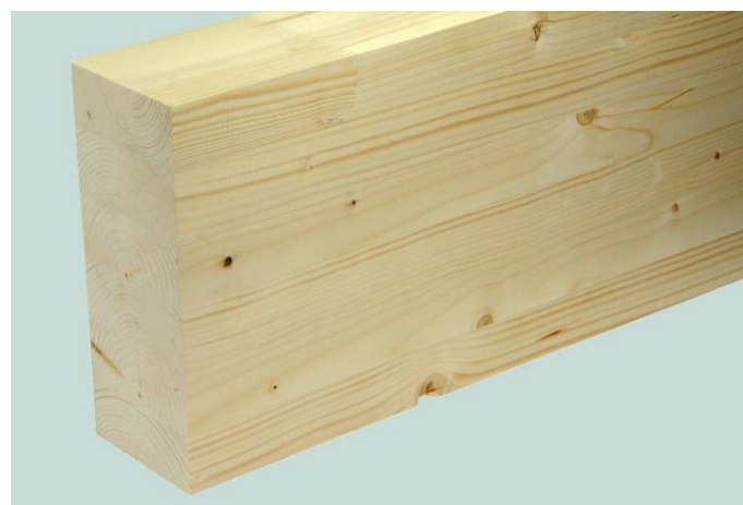
Abbildung 1: Brettschichtholz aus Fichte in Normal-Qualität (N), gehobelt und gefast

Rahmenbaukanteln mit diesen Abmessungen können nicht von allen Produzenten geliefert werden. Die Erhältlichkeit ist abzuklären.