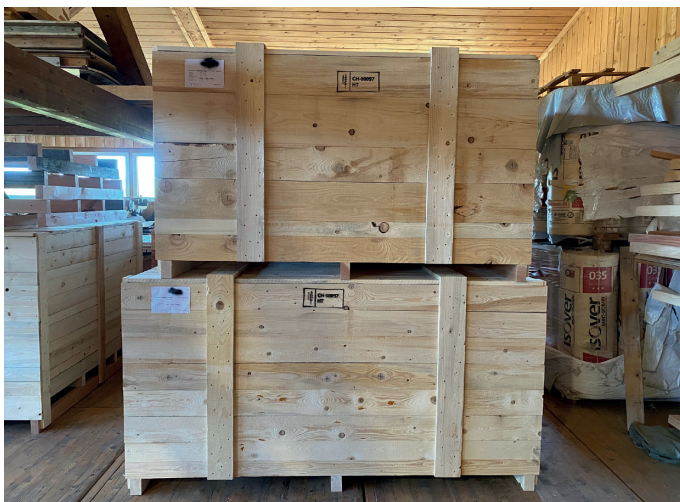
↑ La scierie Lang Sägewerk AG produit également des caisses