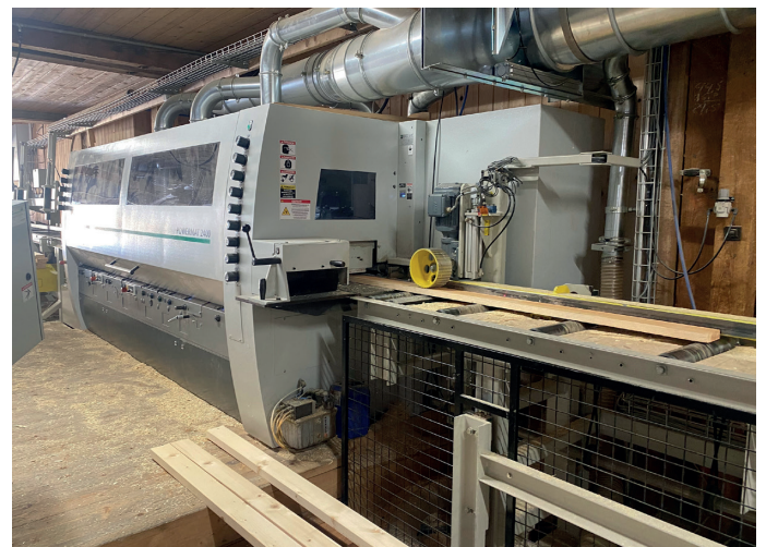
↑ Un investissement pour l'avenir avec une raboteuse multifonctions