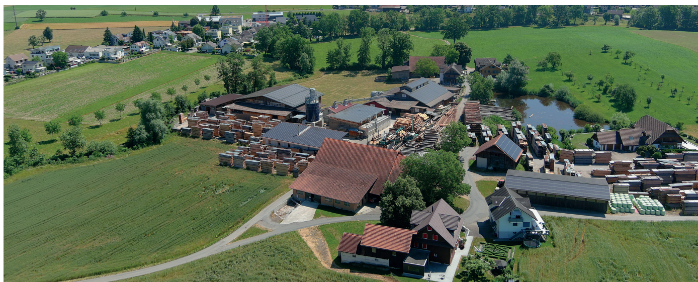
↑ Vue d'ensemble de la scierie Lang Sägewerk AG